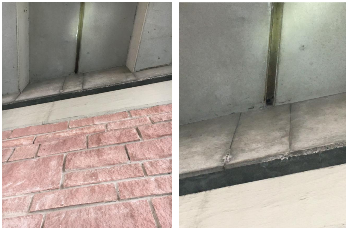
Abb. 9: Fahrbahnunterseite, Brückenauffahrt Wertheim

Die Fahrbahnunterseiten im Bereich der Auffahrten auf die Brücke weisen lange Fugen auf, die lediglich oberflächlich sind und keine tiefen Spalten bieten. Ablauffüllen fehlen hier ebenfalls.