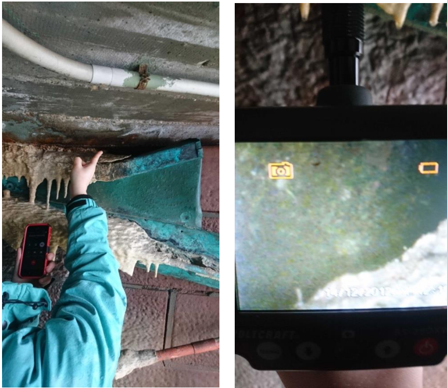
Abb. 6: Sinterablagerungen, Fahrbahnunterseite am Widerlager Wertheim. Kontrolle des Fundaments über der Verkleidung mit dem Endoskop; kein Hohlraum vorhanden