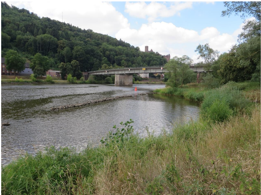
Abb. 1: Brücke über den Main, Blick von Kreuzwertheim Richtung Süden

Die Mainbrücke zwischen Wertheim (Baden-Württemberg) und Kreuzwertheim (Bayern), die die MSP 32 über den Main führt, muss erneuert werden. Die bestehende Brücke wird durch einen Neubau an gleicher Stelle und in gleicher Höhenlage ersetzt. Der Pfeiler im Main wird entfallen, beidseits des Mains erfolgt der Bau von Pfeilern in Ufernähe. Die Brücke selbst ist als Bogenbrücke mit Drahtseilen vorgesehen.