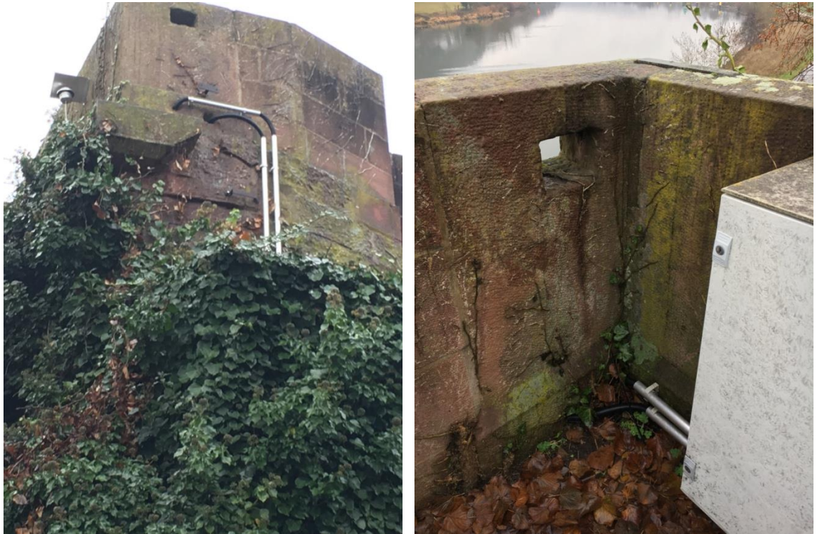
Abb. 8: Kabeldurchführung am Mauerwerk, Widerlager Wertheim

Auf der Ostseite des Wertheimer Widerlagers befindet neben einem Stromversorgungskasten in Bodennähe ein Kabeldurchlass durch das Mauerwerk, für die Stromleitungen zur Versorgung der Fußwegbeleuchtung. Der Mauerdurchbruch ist ca. 25 cm tief, auf beiden Seiten offen und augenscheinlich nicht als frostfreies Quartier für Fledermäuse geeignet.