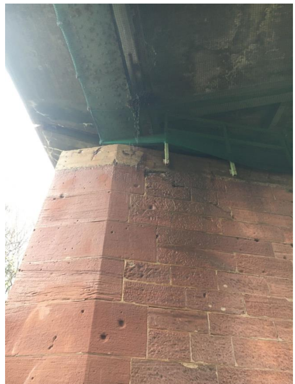
Abb. 2: Widerlager Kreuzwertheim