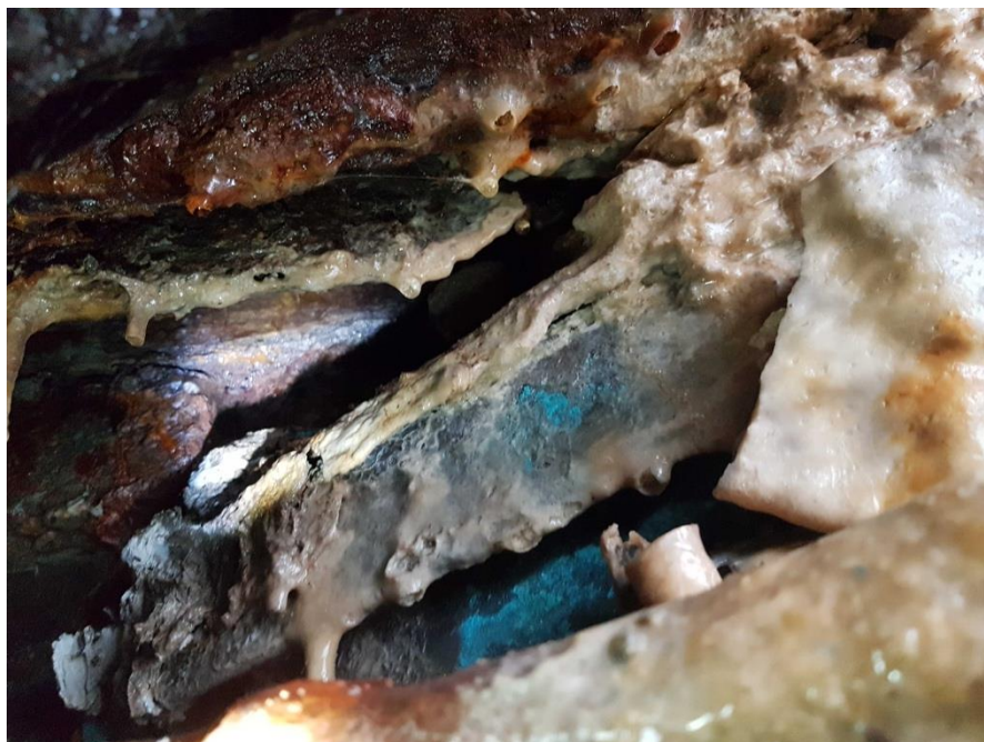
Abb. 5: Widerlager Wertheim, Blick von oben hinter die Sandsteinverkleidung mit Sinterablagerungen, auf der Westseite

Am 28.01.2021 erfolgte eine zweite, ergänzende Kontrolle der wahrnehmbaren Spalten an dem Widerlager auf der Seite Kreuzwertheim, mit Leiter, Endoskop, Vermessung anhand von Vergleichsgegenständen und fotografischer Dokumentation. Es konnte festgestellt werden, dass bei dem an dem Tag vorherrschenden Regenwetter alle Spalten durch herabfließendes Wasser nass waren und somit ungeeignet als Quartiermöglichkeit. Es gab keine Hinweise auf Ein- und Ausflugspuren oder Kotreste. Eine Spalte wurde festgestellt, war aber sehr schmal und damit auch für die sehr kleine Zwergfledermaus nicht als Quartier geeignet (vgl. Abb. 5 bis Abb. 7).