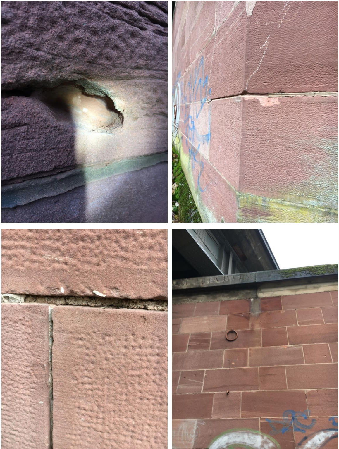
Abb. 3: Widerlager Kreuzwertheim

An der Sandsteinaußenverkleidung der Brückenwiderlager waren einige wenige oberflächliche Vertiefungen im Stein festzustellen, die vielleicht in der Folge von Frosterignissen entstanden sind oder durch mutwilliges Beschädigen. Die Stellen sind aktuell ca. 2 bis 3 cm tief, nicht frostfrei und bieten keinen Schutz bei Regenereignissen