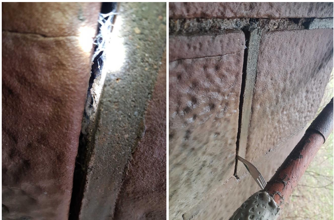
Abb. 7: Kontrolle einer sehr schmalen Spalte in der Sandsteinverschalung

Hinweise auf mögliche Hohlräume haben sich nicht ergeben. Fledermäuse wurden in oder an den kontrollierten Strukturen nicht festgestellt.